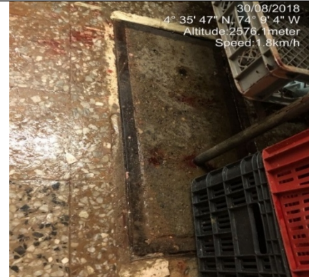
Foto 6. Caja interna sellada.