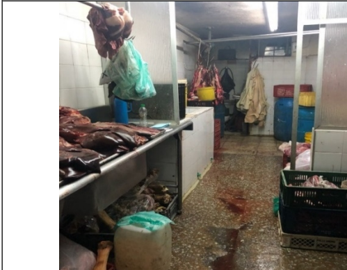
Foto 5. Área de despose y sangre en suelo.