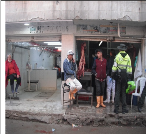
Foto 1. Fachada predio ubicado en la carrera 62 B No. 57 D - 20 Sur con sus dos locales.