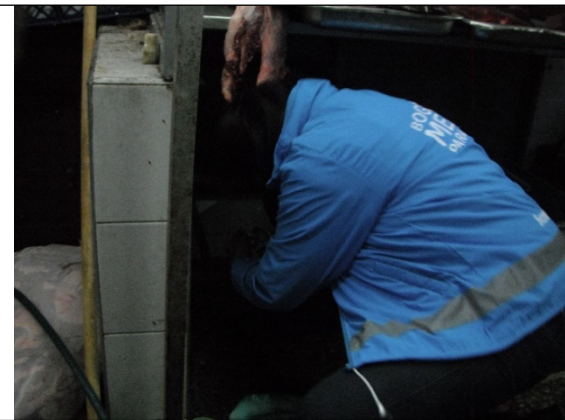
Foto 9. Imposición de sellos al predio ubicado en la KR 62 B No. 57 D - 20 Sur (Predio B).