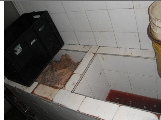
Foto 7. Líquidos, sangre y tejidos en la alberca.