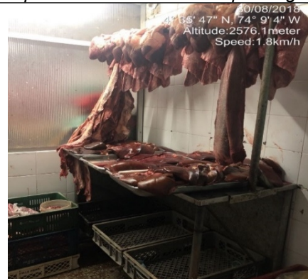
Foto 4. Área de desposte.