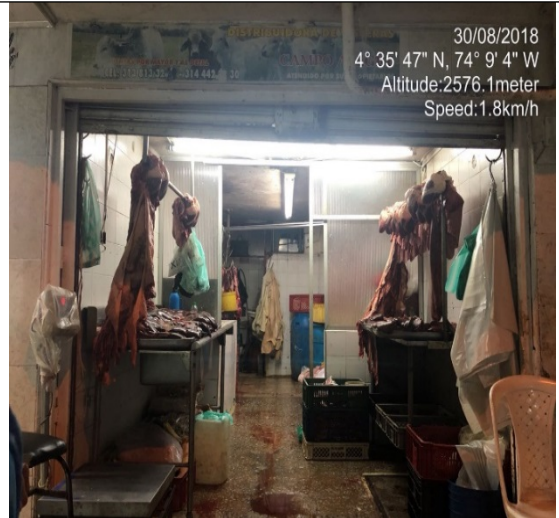
Foto 2. Fachada establecimiento denominado Expendio de Visceras Campo Alegre.