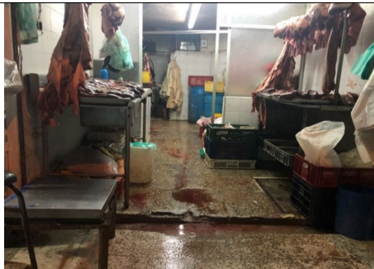
Foto 3. Interior de las instalaciones del local.