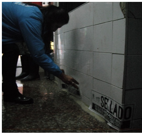
Foto 11. Imposición de sellos al predio ubicado en la KR 62 A 57 D - 03 Sur (Predio B).