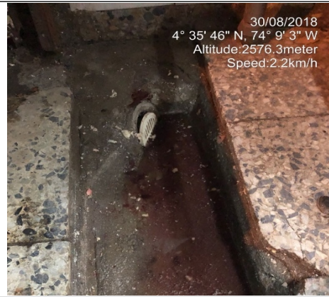
Foto 8. Sangre en cuneta y sifón sellado.