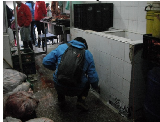
Foto 12. Imposición de sellos los puntos de desagüe de la base de la alberca.