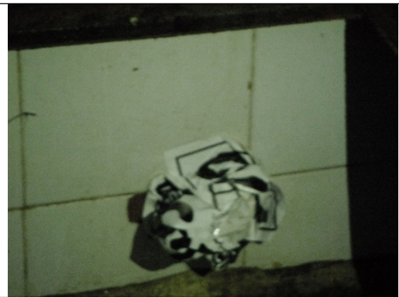
Foto 10. Imposición de sellos en la llave de entrada de agua.